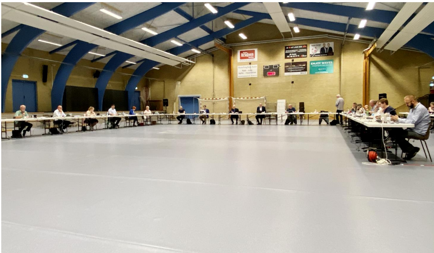
Fra byrådsmødet i Havdrup Idrætscenter den 22. juni 2020. Der manglede ikke plads!

Byrådet har måttet holde de seneste byrådsmøder online, men den 22. juni lykkedes det endelig at holde et fysisk byrådsmøde, denne gang i Havdrup Idrætscenter. Der var ekstremt god plads mellem både byrådsmedlemmerne og ikke mindst mellem byrådet og publikum – især sidstnævnte var et problem, idet der ikke var en mikrofon til de borgere, der ønskede at stille spørgsmål. Forhåbentlig kan dette problem løses til det næste «rullende» byrådsmøde.